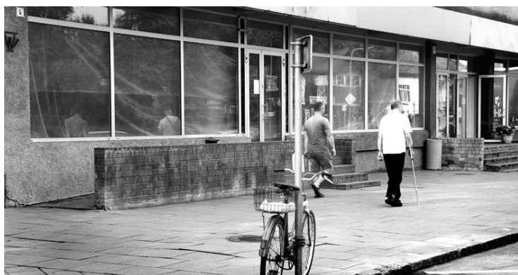
Anykščiuose uždarius SEB banko filialą, tuščios patalpos pritraukioje miesto centrinėje dalyje ilgai tuščios nebuvo – už uždengtų langų jau vyksta patalpų pritaikymas naujai kavinei.