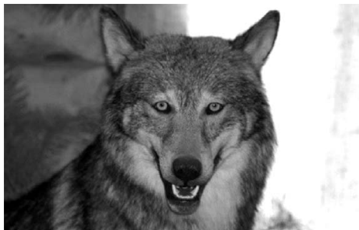
Pirmas vilkas Anykščių rajone šiais metais sumedžiotas Troškūnų seniūnijoje. Medžiotojai turi teisę sumedžioti dar tris vilkus.

„Anykšta“ susisieki su medžiotoju, kuris sumedžiojo vilką, bet nenorėjo prisiimti visos garbės (medžiotojai kalba, kad sumedžioti vilką yra garbė) ir skelbti pavardės. Jis pasakojo, kad tai buvo antrametė patelė. „Pamačiau prieš savaitę, bet iššauti nespėjau, paskambinau kitam medžiotojui, kurio link vilkai bėgo, bet ir jis nespėjo“, - situaciją patvirtino medžiotojas. Jis taip