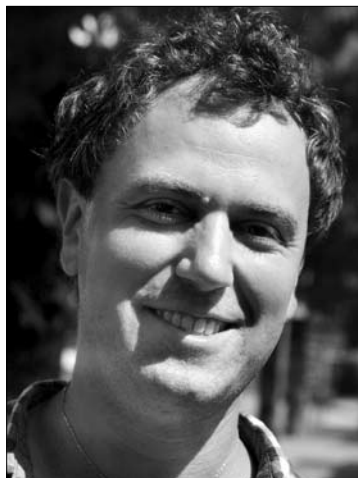
AIGARS, svečias iš Latvijos:

- Dar neatostogavau, tačiau tikiosis atostogauti rugpjūčio pabaigoje. Su žmona ir draugais ruošiamės keliauti į Gruziją. Tikimės ten praleisti savaitę. Beje, Gruzijoje nesu buvęs.