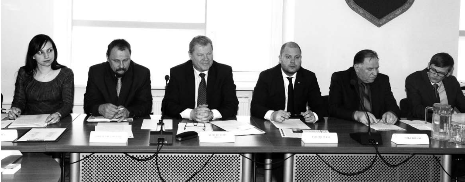
Rugpjūtį, jei nereikės priimti neatidėliotinių sprendimų, rajono Taryba atostogaus. Tuo metu žadama rekonstruoti savivaldybės posėdžių salę.

Ketvirtadienį savivaldybės posėdžių salėje vykęs 18-asis rajono Tarybos posėdis baigėsi vos prasidėjęs. 23 sprendimai priimti bei du informaciniai pranešimai išklausti per 40 minučių. Prieš rugpjūtį numatomas atostogas politikai į viešumą mestelėjo ir vieną ypač svarbią žinią, kokie pokyčiai jau netrukus gali laukti komunalinių atliekų surinkimo ir tvarkymo srityje.