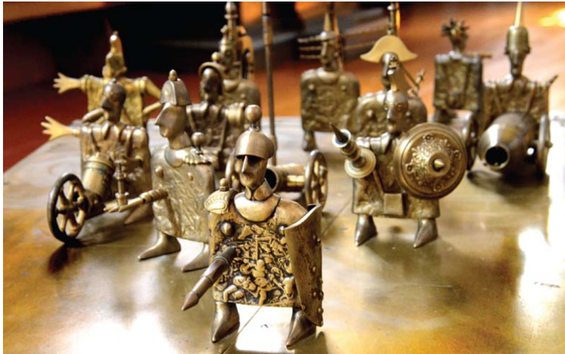
Menininkas sakė, jog dar vaikas pradėjo lipdyti kareivėlius, tik tuomet - dar iš plastilino.