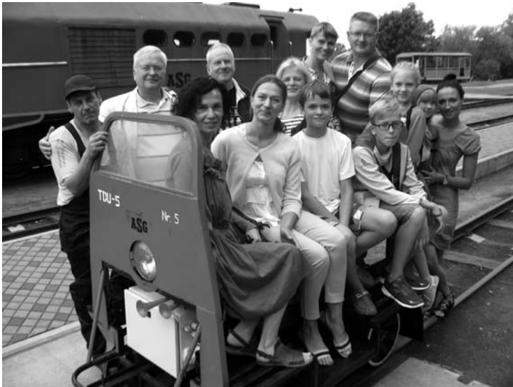
Bandomojo begarsės elektrinės drezinos reiso keleiviai...

Praejęs šeštadienis buvo ypatingas Anykščių siaurojo geležinkelio stotiai, mat iš čia išvyko bei atvyko net penki traukiniai, o greitu laiku visus norinčius iš stoties per tiltą vežiosianti elektrinė drezina tos dienos laiminguosius reklamos tikslais vežiojo nemokamai ir savo trumpąjį maršrutą sukorė net keliolika kartų.