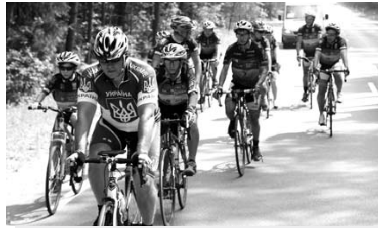
Per Lietuvą dviratininkų komanda iš Ukrainos vyksta į Latviją.